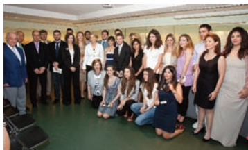
Τελετή απονομής των βραβείων. Μάιος 2010